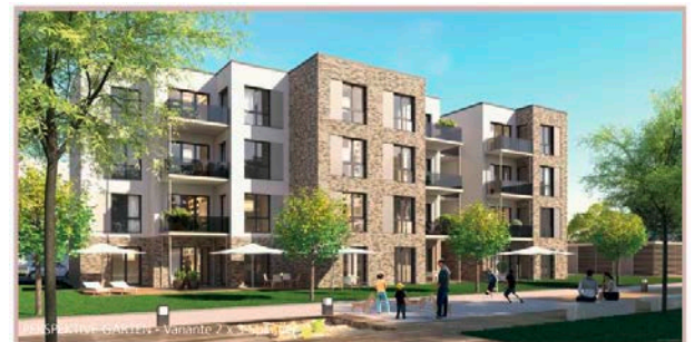
Variante 2 x 3 Spänner

4 Vollgeschosse Einzelgebäude Wohnen im Erdgeschoss ohne Aufzug