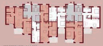
ERDGESCHOSS M 1:200