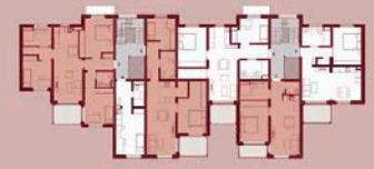
REGELGESCHOSS M 1:200